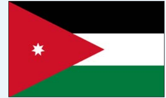
المملكة الأردنية الهاشمية