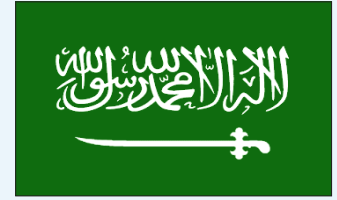
المملكة العربية السعودية